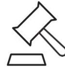
Các tòa án: tại Thành phố & Hạt