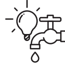
Các dịch vụ công cộng: Điện & nước